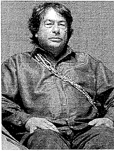
O escritor ocupará a cadeira nº 5, antes ocupada pelo historiador José Murilo de Carvalho

A eleição foi marcada por um inusado conflito público. Na semana passada, Munduruku deu entrevista